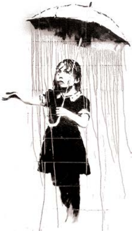
NOLA - UMBRELLA GIRL Apparsa a New Orleans nel 2008, è tra le più apprezzate e maggiormente riprodotte opere di Banksy. Il disegno, omaggio alle 1.836 vittime dell'Uragano Katrina del 2005, raffigura una ragazza in evidente confusione che tendendo una mano scopre che l'ombrello, invece di offrirle protezione, è in realtà la fonte stessa del diluvio.

ATTENZIONE! i rifiuti vanno esposti DOPO LE ORE 18 del giorno precedente alla raccolta