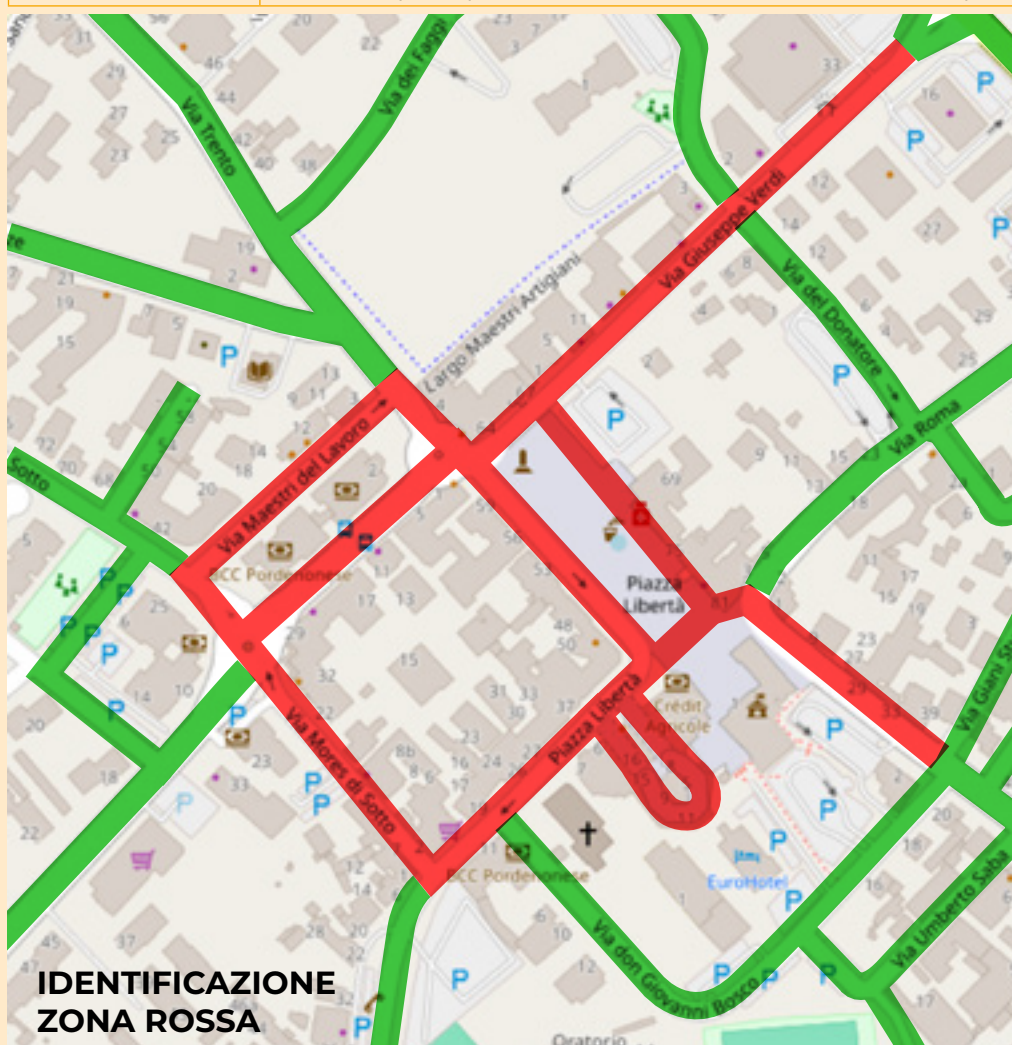
IDENTIFICAZIONE ZONA ROSSA