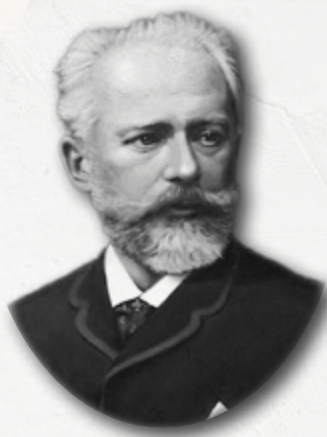
PYOTR ILYICH TCHAIKOVSKY