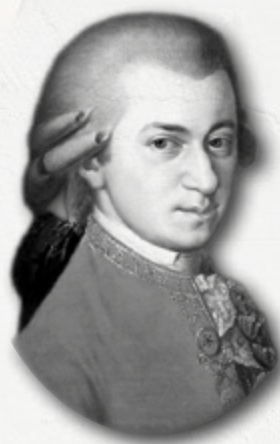
WOLFGANG AMADEUS MOZART