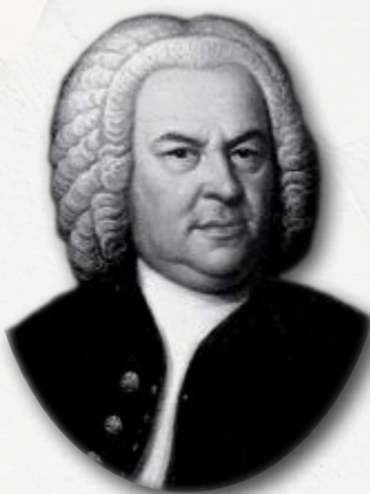
JOHANN SEBASTIAN BACH